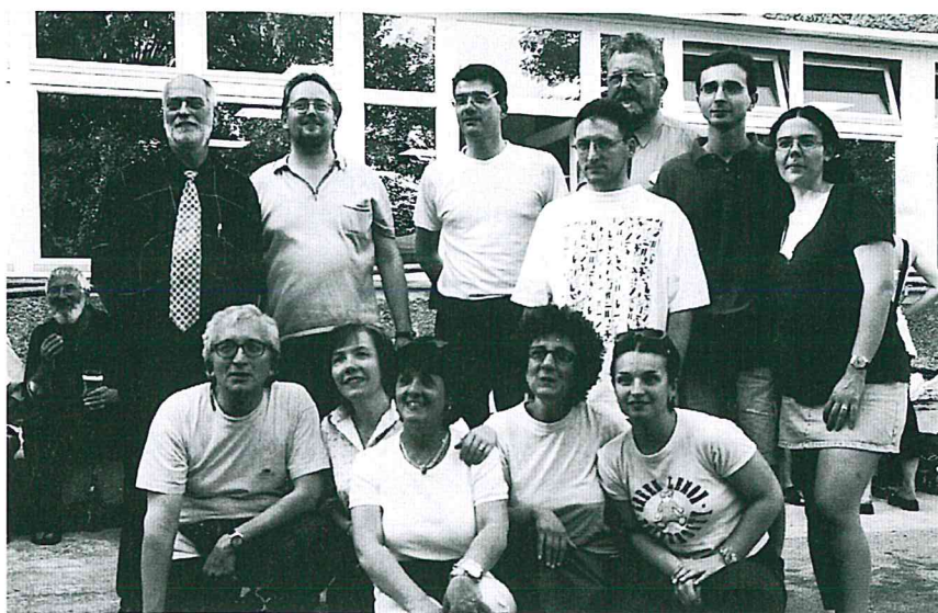
Gli attori de "Il Paese" con il Sindaco di Treptow Sigfried Stock e il Presidente del Consiglio Comunale Grasenick.

Dal 2 al 5 giugno scorsi, infatti, la delegazione dell'Amministrazione di Albinea, invitata per la grande festa annuale di inizio estate a Treptow, era accompagnata dal gruppo teatrale della Coop Il Paese e da una rappresentanza della Pro-loco di Albinea. I primi ricambiavano la visita del settembre '99 di un analogo gruppo teatrale di Treptow che si era esibito presso la Sala Polivalente parrocchiale con un applauditissimo spettacolo, recitando a loro volta sui palcoscenici berlinesi (semplici palchi all'aper-