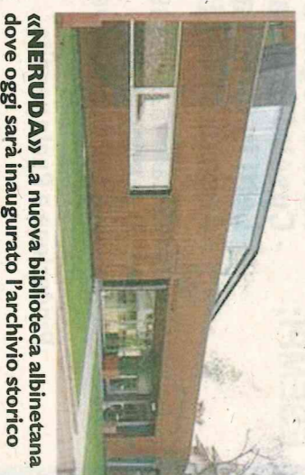
«NERUDA» La nuova biblioteca albinetana dove oggi sarà inaugurato l'archivio storico